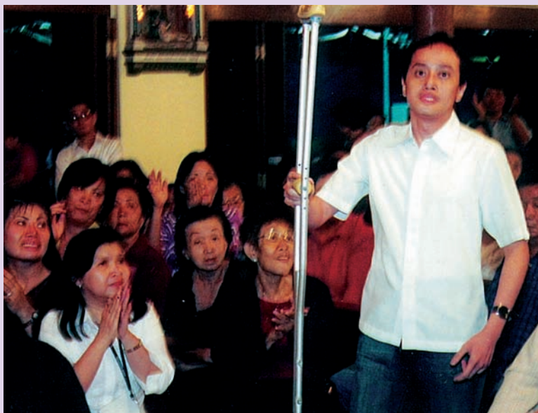
Giovane che a causa di un grave incidente stradale non riusciva più a camminare, durante il ritiro in Indonesia guidato da P. Michele alza le sue stampe e cammina senza difficoltà.